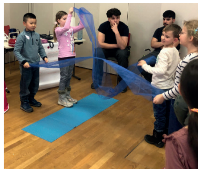
Wasser für das Wasserkraftwerk